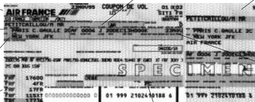
COUPON DE VOL ATB

La classe de voyage, désignée ici par un J, correspond à la classe affaire.