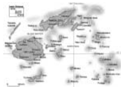
Les aéroports de Nadi et Nausori, tous deux situés sur l'île de Viti Levu, devraient retrouver en 2002 le niveau de trafic de 1999.

Après la mise en place d'un nouveau système de gestion du trafic aérien aux îles Fidji, les aéroports internationaux de Nadi et de Nausori ont entamé des travaux de rénovation en juin 2002. Objectif poursuivi : améliorer le trafic passagers et créer de nouvelles activités commerciales. Sur l'aéroport international de Nadi, plusieurs réalisations sont en cours, comme l'installation de nouveaux comptoirs d'enregistrement, de tapis bagages, d'une nouvelle signalétique et la réfection de la tour de contrôle. Du côté de Nausori, il s'agit de construire une nouvelle tour de contrôle et une caserne de pompiers. Le plan mis en oeuvre par le consortium de l'aéroport de Singapour prévoit l'achèvement des travaux pour les jeux du Pacifique Sud en juin 2003. En effet, à cette occasion, un grand nombre de visiteurs est attendu. Fidji se remet peu à peu de ses troubles politiques récents. Les deux aéroports devraient retrouver cette année un trafic égal à celui de l'année 1999, quand un million de passagers transitaient par Nadi et plus de 50 000 par Nausori. Le premier ministre local espère que l'expansion de ces aéroports attirera plus de visiteurs, et favorisera également l'investissement.