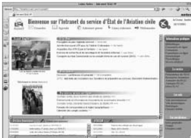
L'intranet du service de l'aviation civile a été lancé en septembre 2002. La plupart des agents disposant de l'outil Lotus Notes y ont accès.

Les agents du service de l'aviation civile disposent depuis peu d'un nouvel Intranet. Le projet, lancé en juillet 2002, a permis la réalisation d'un portail vers un ensemble d'applications et bases d'informations hébergées. Petite visite guidée d'un outil qui est déjà entré dans les habitudes.