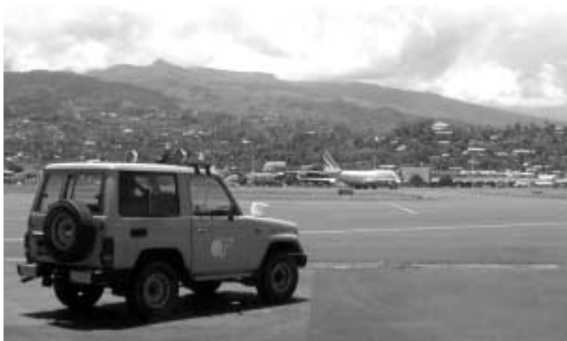
La piste de Tahiti-Faa'a est inspectée quotidiennement par les services de l'aviation civile afin de garantir la sécurité des avions.

Mais il est vrai également, qu'une réglementation, aussi bien pensée soit-elle, ne peut suffire à elle toute seule si l'ensemble des partenaires n'est pas convaincu que chacun, à son niveau, doit être attentif, rigoureux et exigeant pour maintenir en état de propreté décent la totalité des aires qu'il utilise.