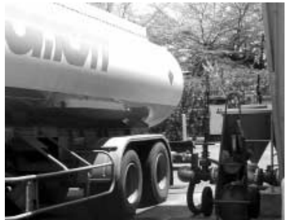
Partie émergée de la station de refoulement de l'aéroport de Tahiti-Faa'a où le carburant destiné aux gros porteurs est livré.

Outre les conduites, le plan de développement de l'avitaillement en carburants de l'aéroport de Tahiti Faa'a prévoit l'extension des cuves de stockage et une fiabilisation de leur remplissage à partir de Motu Uta par pipe-line ou barge de ravitaillement.