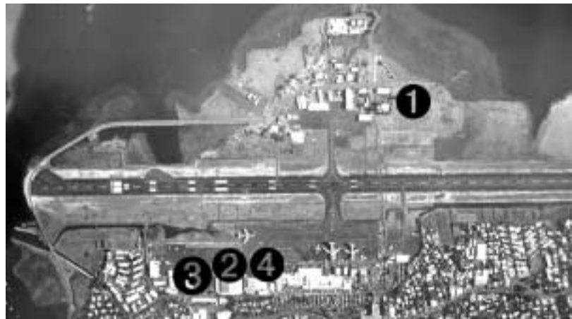
Zone nord ou zone sud ? Les débats quant au lieu d'implantation du hangar Air Tahiti Nui sur l'aéroport de Tahiti-Faa'a sont ouverts.

Pour l'heure, le débat reste ouvert tant les enjeux fonciers et financiers sont importants. La base aérienne 190 étudie les conséquences d'une éventuelle implantation du hangar sur ses installations, en lieu et place de l'actuel hangar CIP. La compagnie Air Tahiti Nui, de son côté, s'est organisée depuis son démarrage pour répondre aux besoins d'entretien de ses appareils. Les visites dues tous les jours, toutes les semaines ou de rang A (environ toutes les sept semaines) se font à Faa'a sur le tarmac. Les visites « check C » (tous les 18 mois) qui immobilisent les avions une à deux semaines ont lieu à Paris dans les hangars d'Air France.