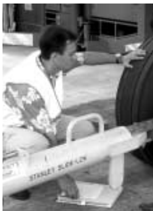
L'examen attentif de l'aéronef permet de détecter une anomalie éventuelle.